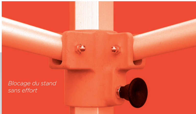
Blocage du stand sans effort