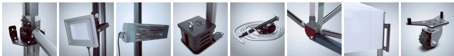
Barre de renfort